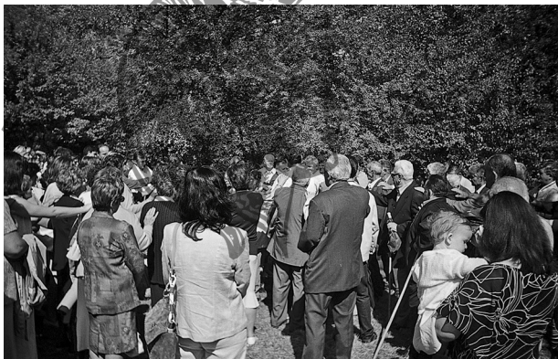
Εικ. 2, 3, 4. Αρτοκλασία στον ναό της Μεταμορφώσεως του Σωτήρος, 6 Αυγούστου 2005. ΚΛ χφο. 5.059 (Ενάγγ. Καραμανές, 2005).