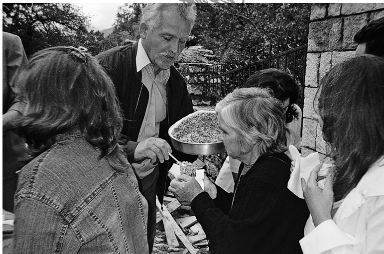
Εικ. 5. Διανομή άρτων και εορταστικών κόλλυβων, 6 Αυγούστου 2005. ΚΑ, χρο. 5.059 (Ενάγγ. Καραμανές, 2005).