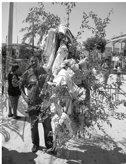
Φωτ. 8. Μαυροθάλασσα, συνοικία Πύργος 2008. Πανηγύρι της αγίας Μαρίνας. Κάτοικος της συνοικίας κρατώντας το κλαδί με τα αφιερώματα, κατά τη διάρκεια της περιφοράς στα σπίτια του χωριού.