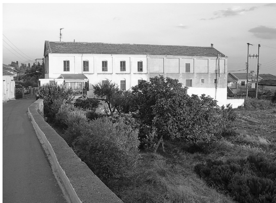
Φωτ. 6. Εμμανουήλ Παπάς 2008. Το καπνομάγαζο του Α. Αλευρά, όπως διατηρείται σήμερα.