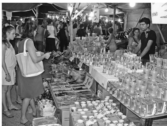
Φωτ. 3. Ηράκλεια 2007. Ετήσιο εμπορικό πανηγύρι.