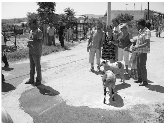
Φωτ. 9. Μαυροθάλασσα, συνοικία Πύργος 2008. Πανηγύρι αγίας Μαρίνας. Ρομά κάτοικοι της συνοικίας με ζώα-αφιερώματα στην πομπή προς την εκκλησία.