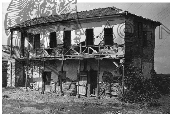
Φωτ. 2. Εμμανουήλ Παπάς 1981. Οίκημα αρχών του 20ού αι., όπου έμεναν καπνεργάτες του χωριού. Σήμερα έχει κατεδαφιστεί.