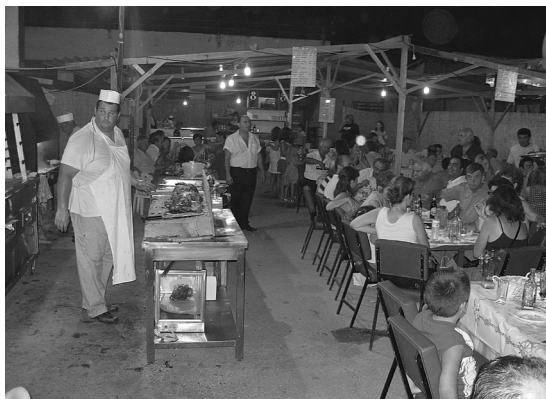
Φωτ. 4. Ηράκλεια 2007. Μία από τις ψησταριές μέσα στο χώρο της εμποροπανήγυρης.