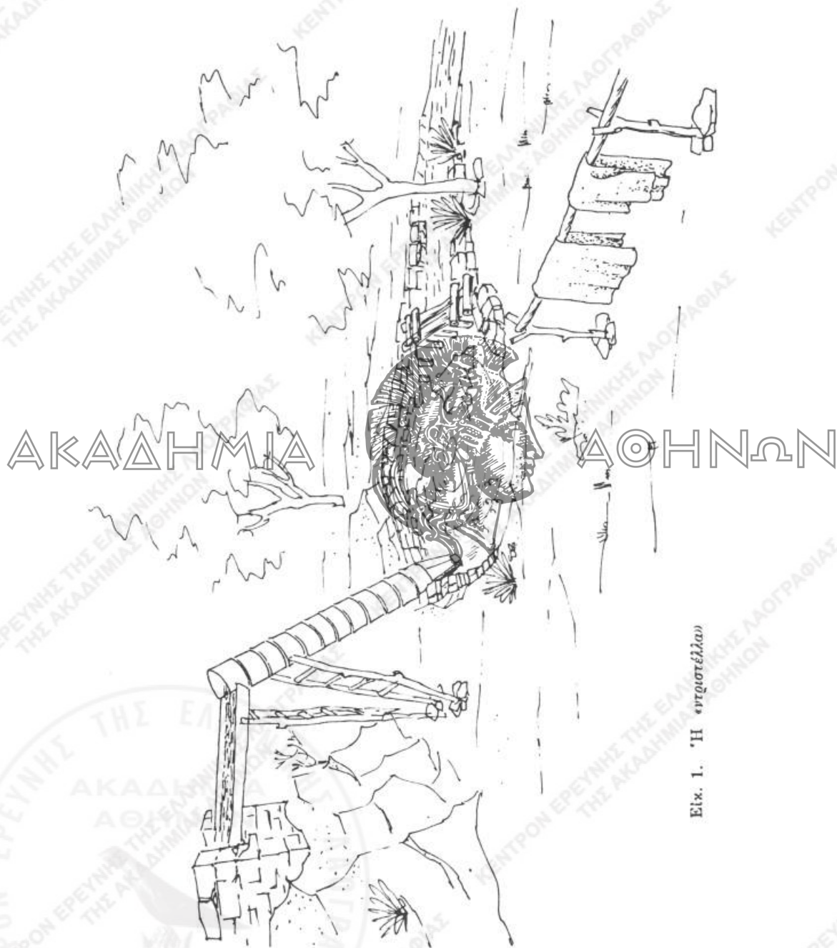
Εικ. 1. «Η «στριγγέλλα»