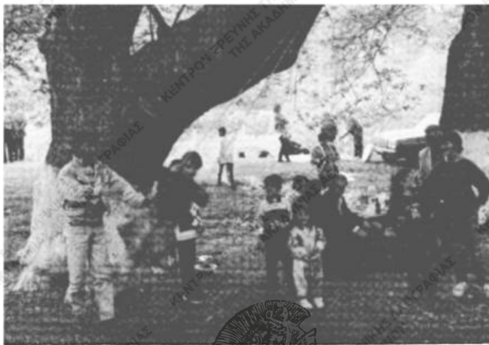
Εικ. 5. Παραδοσιακές κινήσεις τρέπουν τὰ παιδιά.