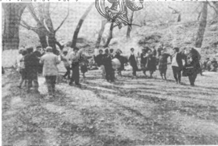
Είχ. 4. Χορός με ζουρνάδες και νταούλι.