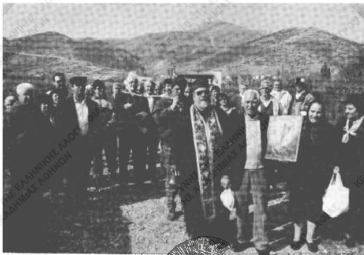
Είχ. 1. 'Από την περιφορά και την Ημέστη της Διακαινησίμου. 'Η πομπή πλησιάζει στα Ζωοδόχου Πηγής.