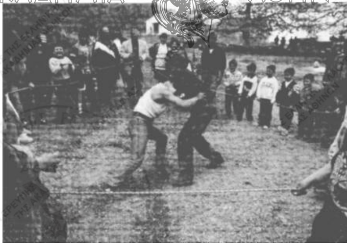
Εικ. 6. Πάλη παιδιών. Στο βάθος τὸ ξωκκλήσι τοῦ Ἀγίου Γεωργίου.