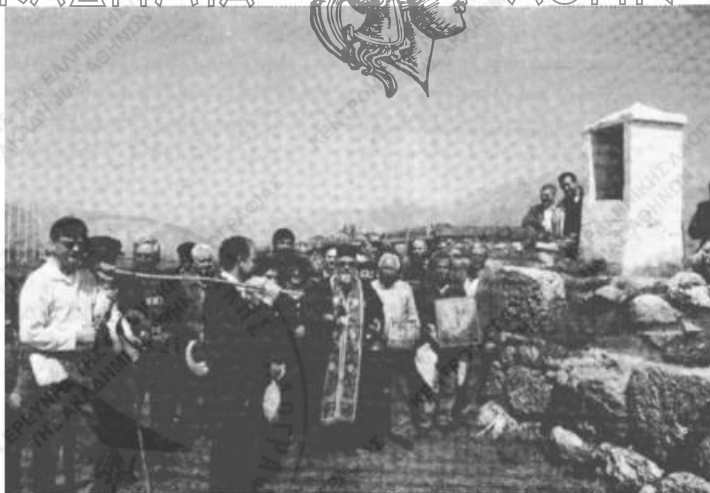
Είχ. 2. Στάση και δέηση σὲ προσκυνητάρι τοῦ Ἁγίου Ἀθανασίου, πάνω στὰ τείχη ἱεροῦ τοῦ Διονύσου.