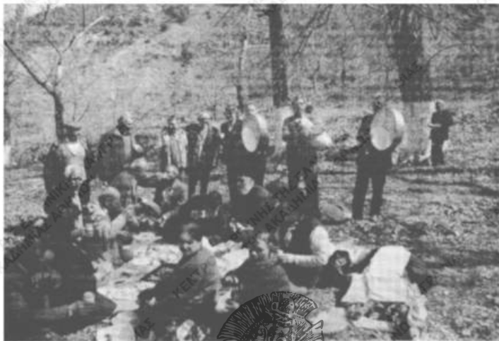
Είχ. 3. Εύωχία με γκιόνα και σταχρόδες.