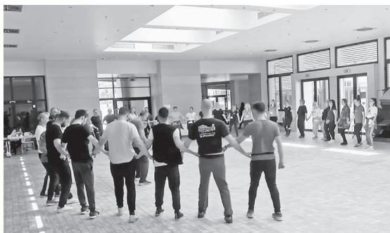
Εικ. 5. Μάθημα παραδοσιακών χορών του «Πολιτιστικού και Λαογραφικού Συλλόγου Κοζάνης “Η Κόζιανη”». Φωτ. Ζωή Ν. Μάργαρη, Κοζάνη 2019.

Εικ. 4. Οργανωμένο γλέντι χορευτικών ομάδων πολιτιστικού συλλόγου με έδρα την Αττική. Στο κέντρο διακρίνονται τα νεαρότερα μέλη των ομάδων να χορεύουν μαζί με τα μεγαλύτερα και με τα μέλη της ομάδας των παραστάσεων υπό τους ήχους της ορχήστρας του