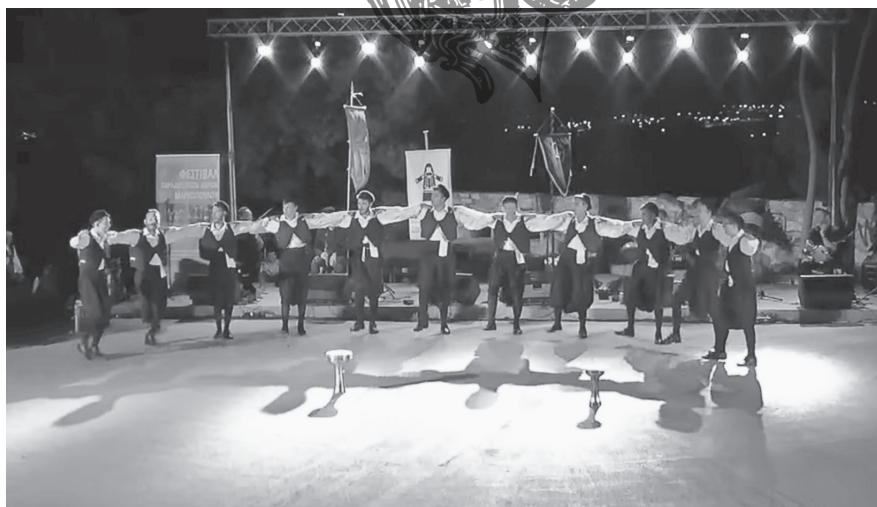
Εικ. 9. Αναπαράσταση αποκριάτικων εθιμικών χορευτικών δρωμένων από τον Μεσότοπο Λέσβου στο πλαίσιο του 2 ου Φεστιβάλ Παραδοσιακών Χορών Μαρκοπούλου που διοργάνωσε ο «Χορευτικός Λαογραφικός Όμιλος Μαρκοπούλου και Πόρτο Ράφτη “Μυρρινούς”» στο Μαρκόπουλο. Ερμηνεύουν τα μέλη του Συλλόγου. Φωτ. Ζωή Ν. Μάργαρη, Μαρκόπουλο 2018.