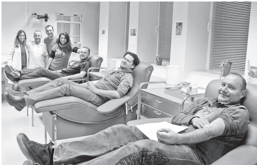
Εικ. 19. Εθελοντική αιμοδοσία της χορευτικής ομάδας «Χοροβάτες», Αθήνα 2018. Στόχος της ομάδας που ιδρύθηκε το 2009 είναι «η διάδοση της Ελληνικής Λαϊκής Παράδοσης και Πολιτισμού, μέσω της διδασκαλίας παραδοσιακών χορών και τραγουδιών σε άτομα κάθε ηλικίας, τόσο ελληνικής όσο και αλλοδαπής καταγωγής».