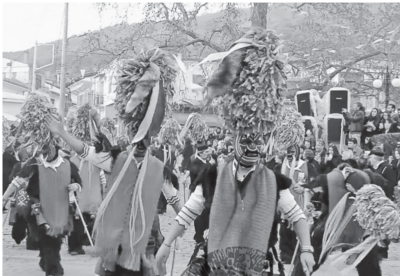
Εικ. 6. Εθμική επιτέλεση των αποκριάτικων εθμικών δρωμένων των «Καρναβαλιών» του Σοχού. Φωτ. Ζωή Ν. Μάργαρη, Σοχός 2002.