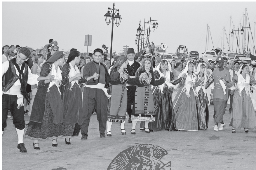
Εικ. 8. Χορευτικές ομάδες που συμμετέχουν στις εκδηλώσεις του Διεθνούς Φεστιβάλ Φολκλόρ Λευκάδας. Λευκάδα 2012.