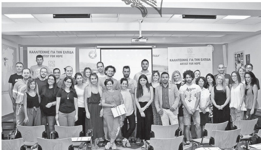
Εικ. 20. Τα μέλη της ομάδας «Χοροβάτες» που έγιναν, μετά από την παρακολούθηση σχετικής ενημερωτικής εκδήλωσης, εθελοντές δότες μυελού των οστών, Αθήνα 2018. Πηγή: Φωτογραφικό Αρχείο Χορευτικής Ομάδας «Χοροβάτες».