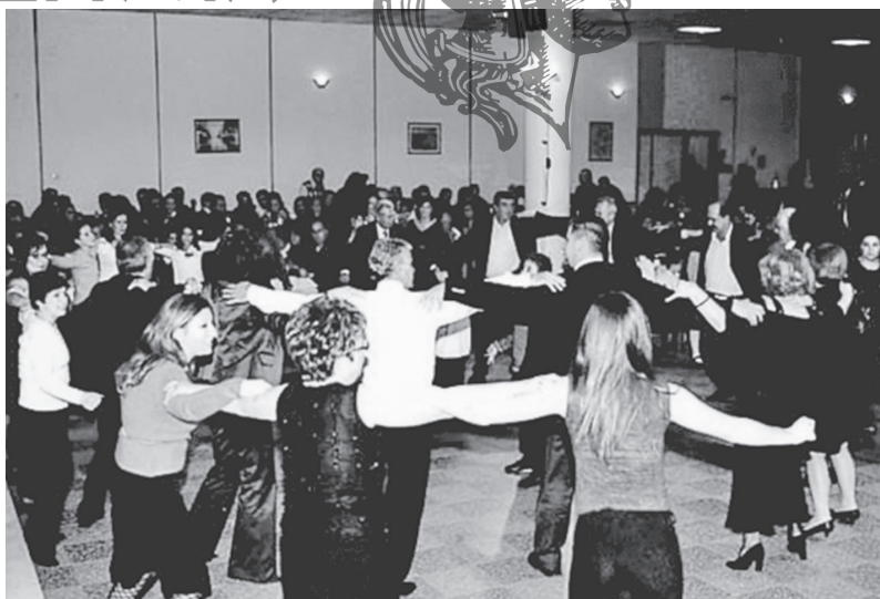
Εικ. 1-2. Χοροεσπερίδα χορευτικής ομάδας πολιτιστικού συλλόγου με έδρα την Αττική. Μετά από την παραστασιακή επιτέλεση μίας σουίτας θρακιώτικων χορών που ερμήνευσαν ορισμένα εκ των μελών της ομάδας (εικ. 1) τα μέλη του συλλόγου ερμηνεύουν όλα μαζί, μεταξύ άλλων, τους ίδιους θρακιώτικους χορούς (εικ. 2). Αθήνα 2000.