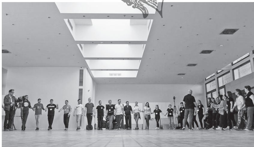
Εικ. 15. Μαθήματα παραδοσιακών χορών στο πλαίσιο του «3 ου Σεμιναρίου Χορού και Λαογραφίας» που διοργάνωσε ο «Πολιτιστικός και Λαογραφικός Σύλλογος Κοζάνης "Η Κόζιανη"». Φωτ. Ζωή Ν. Μάργαρη, Κοζάνη 2019.