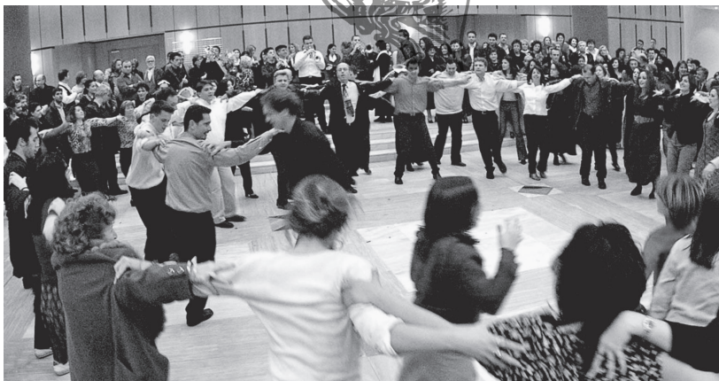
Εικ. 22. Γλεντικά χορευτικά επεισόδια που έλαβαν χώρα μετά την παράσταση «Αποκριάτικα με τη Δόμνα Σαμίου» που πραγματοποιήθηκε την 5 η Μαρτίου 2003 στο Μέγαρο Μουσικής Θεσσαλονίκης. Χορεύουν σε κοινό κύκλο μέλη χορευτικών ομάδων πολιτιστικών συλλόγων που συμμετείχαν στην παράσταση και θεατές που την παρακολούθησαν υπό τους ήχους της ορχήστρας των χάλκινων πνευστών «Λόξιους κι Ανακατουσιά» από την Κοζάνη.