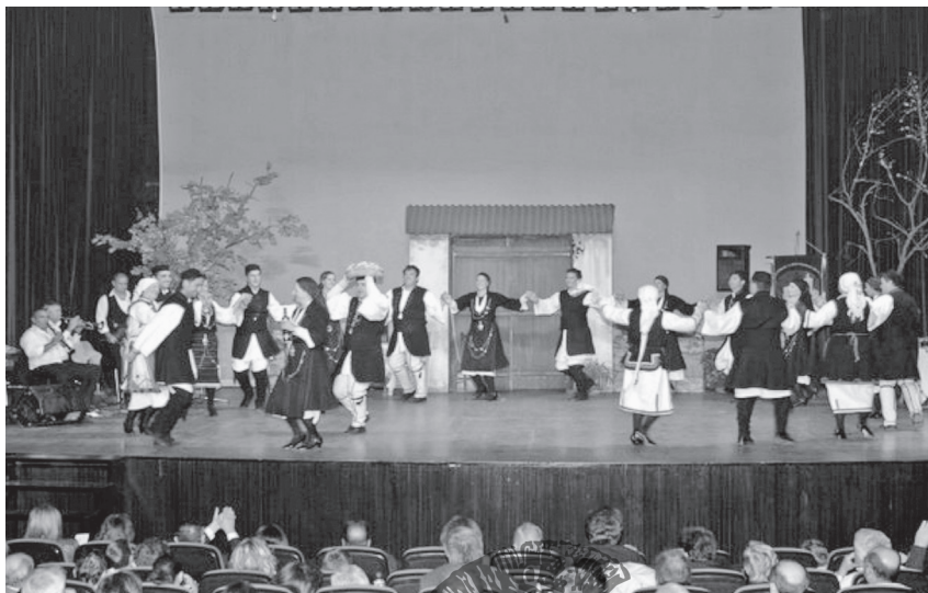
Εικ. 14 Αναπαράσταση εθνικών χορευτικών δρώμενων του γάμου στο πλαίσιο της παράστασης παραδοσιακών χορών που διοργάνωσε ο «Πολιτιστικός και Λαογραφικός Σύλλογος Κοζάνης "Η Κόζιανη"» στην Κοζάνη. Φωτ. Ζωή Ν. Μάργαρη, Κοζάνη 2009.