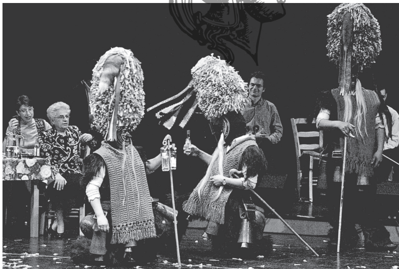
Εικ. 7. Παραστασιακή επιτέλεση των γλεντικών επεισοδίων των αποκριάτικων εθμικών δρωμένων των «Καρναβαλιών» του Σοχού στο πλαίσιο της παράστασης «Αποκριάτικα με τη Δόμνα Σαμίου» που πραγματοποιήθηκε την 5 η Μαρτίου 2003 στο Μέγαρο Μουσικής Θεσσαλονίκης.