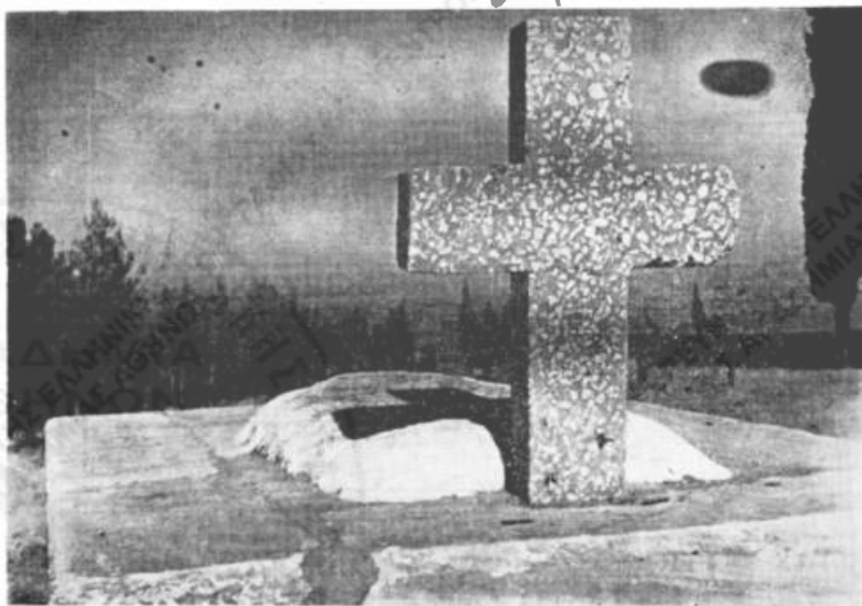
Εικ. 7. Ἡ πλάξ τῆς ὁποίας ἡ κόνις χρησιμοποιεῖται ὡς αἰμοστατικὸν μέσον.