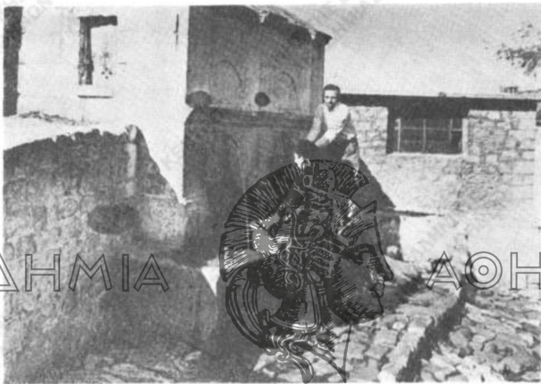
Εἰκ. 1. Κρήνη εἰς Φανάρι, στοιχειωμένη.

Α' α') «Όταν φτειάναν τὴν κάμαρα (=γεφύρ') τοῦ χωριοῦ μας κάτω στὰ Μύλια (ἀνατολ. τοῦ χωρίου)... ἔπιφτι, δὲν στέριωνι κ' ἔτριμι. Οἱ μαστόρ' τότε εἶπαν ὅτι πρέπ' νὰ σφάζ'νι κάποιον, νὰ βάλ'νι γιὰ νὰ στεριώσ'. Ἔτο' ὅπου πιρνοῦσαν οἱ Τοῦρκ', πιάσαν ἕναν Τούρκου κὶ τοὺν στοιχειῶσαν, τοὺν σφάζαν κὶ τοὺν ἔβαλαν στὰ θεμέλια. Μόλις τοὺν ἔβαλαν στὰ θεμέλια, σταμάτ'σι ἡ καμάρα. Γίν'κι ἡ καμάρα κὶ πιρνοῦσι ἡ κόσμους ἀπὸν πάν', ἀλλὰ σκιαζοῦμάστιαν νὰ πιράσουν, γιὰτὶ λέγαν ὅτι ἦταν ἡσκιουμα....» ("Ἁγιος Ἀκάκιος (Γόλτσα), χειρ., σ. 203-204).