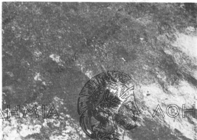
Εἰκ. 4. Ἴχνη τοῦ πέλματος βασιλέως καὶ τῆς ὀπλῆς τοῦ ἵππου του.

Ἡ πίστις περὶ τῆς ἐμφανίσεως ἐντὸς τῆς οἰκίας ὄφως ὡς ἱεροῦ εἶναι καὶ ἐνταῦθα πολὺ κοινὴ (χειρ., σ. 185, 242, 381 κ.ά). Ὁ ὄφης οὗτος δὲν φονεύεται ὑπὸ τῶν ἐνοίκων, ἀντιθέτως μάλιστα τυγχάνει καλῆς μεταχειρίσεως, διότι θεωρεῖται φύλαξ τῆς οἰκίας, ὡς ὁ οἰκουρὸς ὄφης κατὰ τὴν ἀρχαιότητα.