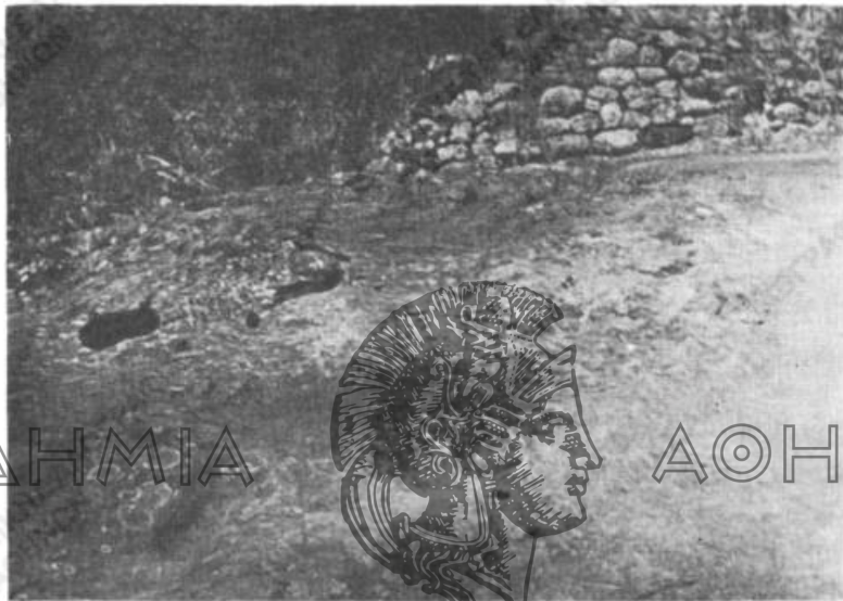
Εἰκ. 5. «Δράκου πατ'μασιά» εἰς Φανάρι.

Ἐγγὺς τοῦ χωρίου Φανάρι ὑπάρχουν καὶ ἄλλα ἀποτυπώματα περὶ τῶν ὁποίων