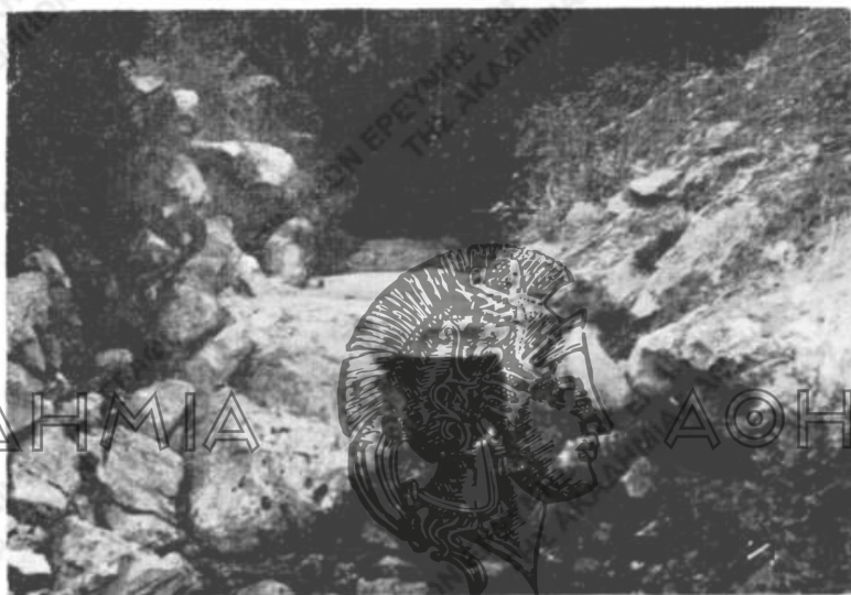
Εἰκ. 2. Στοιχειωμένη πηγὴ εἰς Ἅγιον Ἀκάκιον.

στ') «Μεῖς ἔχ'μι ἕνα τόπου κὶ τοὺν λέμι Χαβούζ' (ἀνατολ.). Πρῶτα ἦτανι βρύσ', τώρα λούμουσι (=γιόμουσι χώματα). Αὐτοῦ λένι, ἔισ' τὸ ἔχ'μι ἀκ'στά, οἱ