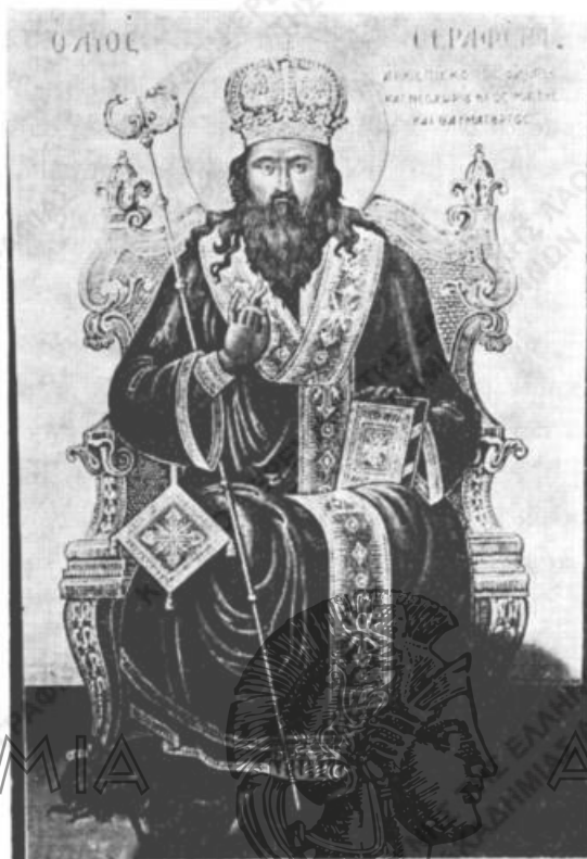
Εικ. 6. Ὁ Ἅγιος Σεραφείμ πατὼν τὴν πανώλη.