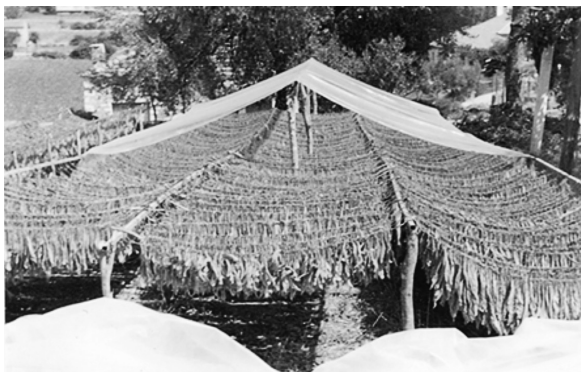
Εικ. 10. Καπνά στις λιάστρες. Μαχαιράς 1983 (αρ. χ/φου 4215).