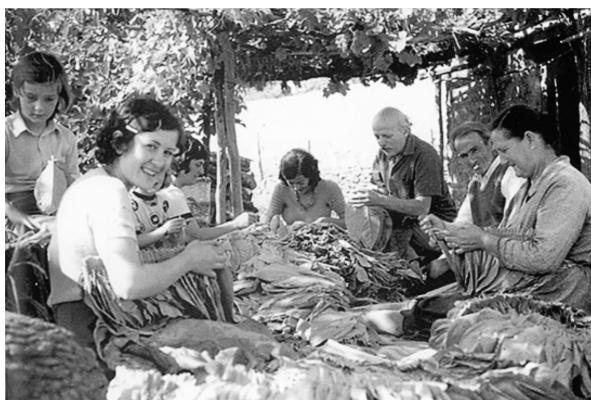
Εικ. 9. Αρμάθιασμα καπνού, δεκαετία του 1970.