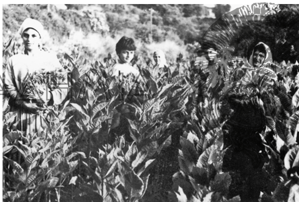
Εικ. 8. Μάζεμα καπνού. Από τη δεκαετία του 1970 η αγροτική παραγωγή περιορίστηκε στην καλλιέργεια του καπνού.