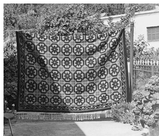
Εικ. 7. Κιλίμι υφαντό. Υφάντρα η Σταυρούλα Βότση κάτοικος Μαχαιρά (αρ. χ/φου 4215)