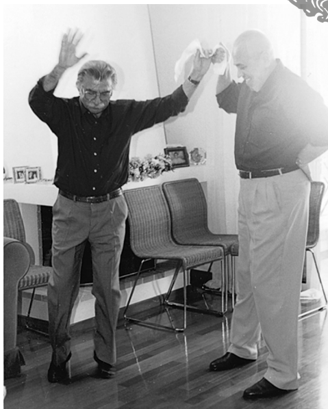
Εικ. 14. Αγία Παρασκευή, προάστιο Αθήνας, 10-9-2000. Ξηρομερίτης (με την ευκαιρία κάποιας βάπτισης) χορεύει τον τσάμικο με τον «ξηρομερίτικο» τρόπο, που είναι αναγνωρίσιμος. (Δεξί χέρι σηκωμένο ψηλά, αυτοσυγκέντρωση, μεγαλείο και χάρη).