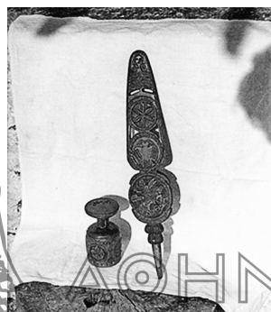
Εικ. 3. Ξυλόγλυπτη κούπα και ρούκα, δείγμα ντόπιας ξύλογλυπτικής. Ξυλόγλυπτης, ο Μαχαιριώτης δάσκαλος Γεράσιμος Ηρ. Παπατρέχας. (αρ. χ/φου 4215).