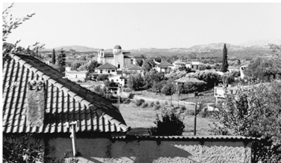
Εικ. 1. Αποψη του χωριού Μαχαιράς (επαρχία Ξηρομέρου νομού Αιτωλοακαρνανίας).