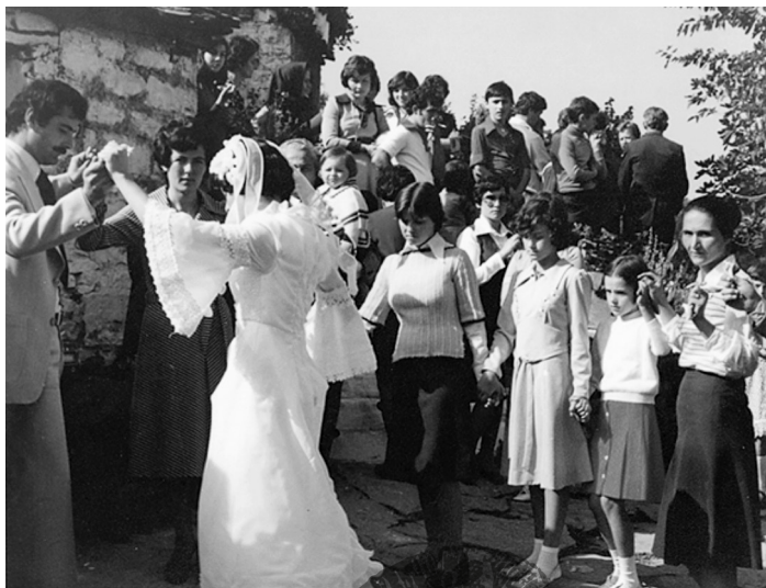
Εικ. 13. Απόλυτη προσήλωση στο γαμήλιο χορό φανερώνουν τα πρόσωπα που παρίστανται. Δεκαετία του 1970.