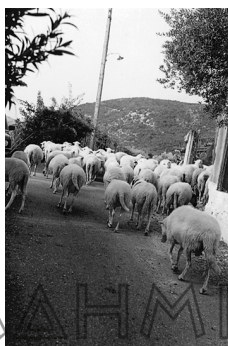
Εικ. 2. Τώρα (2009) έχουν απομείνει λίγα μικρά κοπάδια αιγοπροβάτων στην πρότερον και έξοχην κτηνοτροφική περιοχή του Ξηρομέρου (επιτόπια έρευνα 2006).