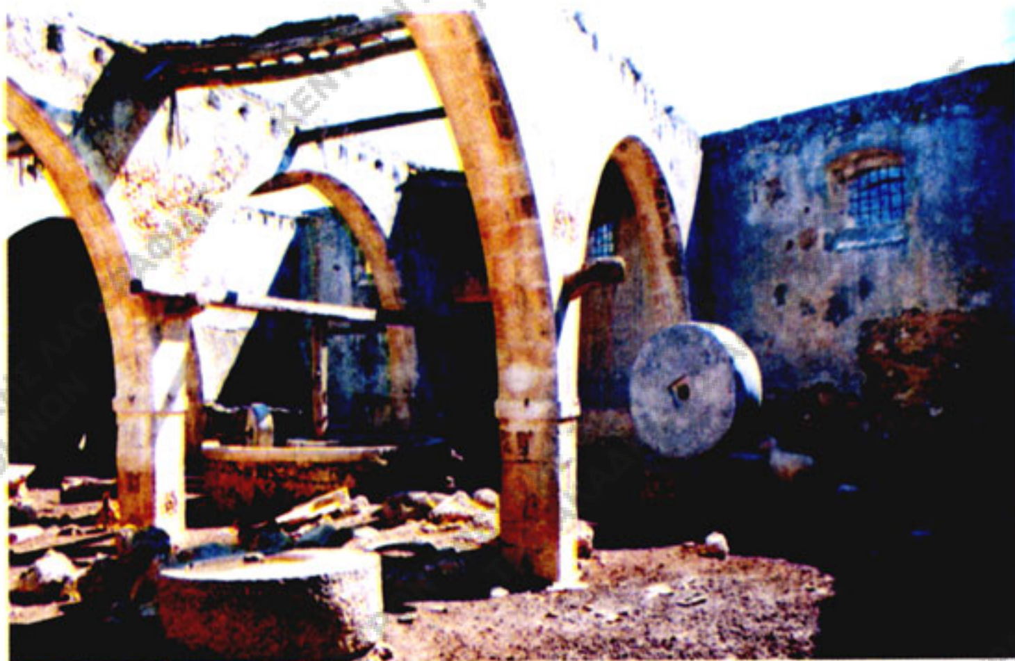
Εικ. 3. Ερείπια μεγάλου ελαιοτριβείου της βενετοκρατίας με πολλές καμάρες στον πύργο του χωριού Μαρουλάς Ρεθυμνου. Διακρίνονται η βάση του μύλου, η κατώπετρα, πάνω στην οποία γυρίζουν τα μυλάκια (μυλόπετρες), το κάθετο ξύλο, γύρω από το οποίο περιστρέφονταν οι μυλόπετρες, διάφορες μυλόπετρες κ.ά. (Φωτ. Χρυσούλας Ζήκου, την οποία ευχαριστώ και από εδώ, Χανιά 2000).