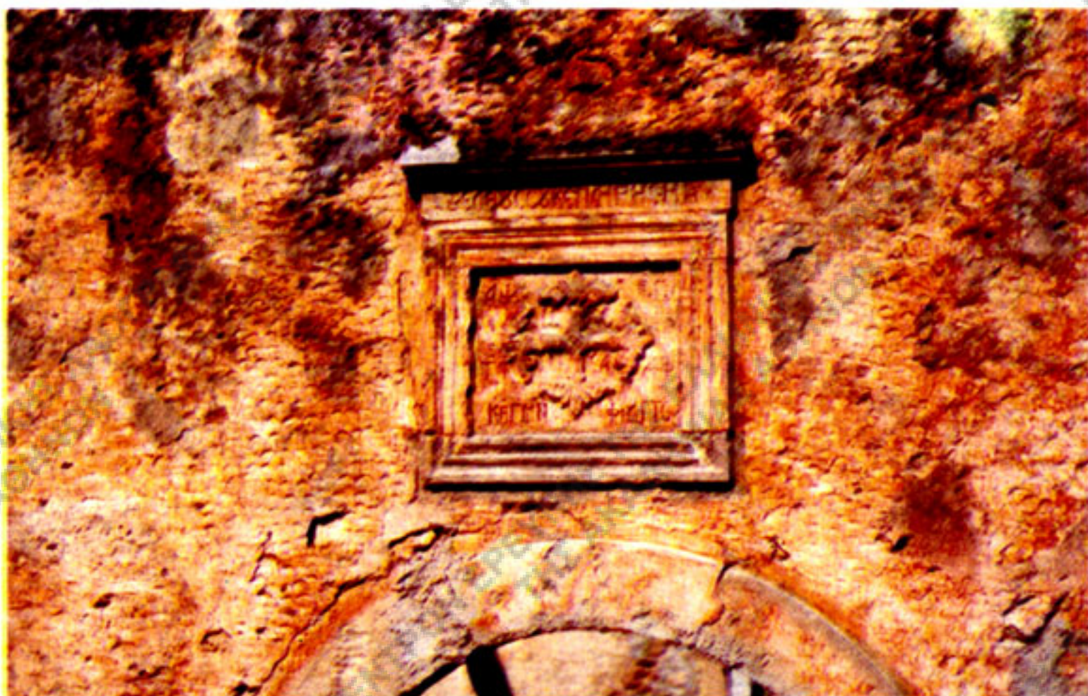
Εικ. 8. Η κτητορική (;) επιγραφή πάνω από την είσοδο του κυρίως ελαιοτριβείου της Μονής Αρκαδίου στο μετόχι της στον οικισμό Καψαλιανά Αμινάτου Ρεθύμνης με τη χρονολογία ΑΨΞΓ' (1763) στο πάνω μέρος, αριστερά και δεξιά, του έργου λιθανάγλυφου σταυρού. Στο πάνω μέρος η ρήση «ΤΟΥ ΕΛΕΟΥΣ ΣΟΥ ΚΥΡΙΕ ΠΛΗΡΗΣ Η ΓΗ» και κάτω «Κ(Α)Θ(Η)Γ(Ο)ΥΜ(Ε)Ν(Ο)Σ ΦΙΛΑΡ(Ε)Ι(Ο)Σ» (Φωτ. Παναγ. Καμηλάκη, 1999).