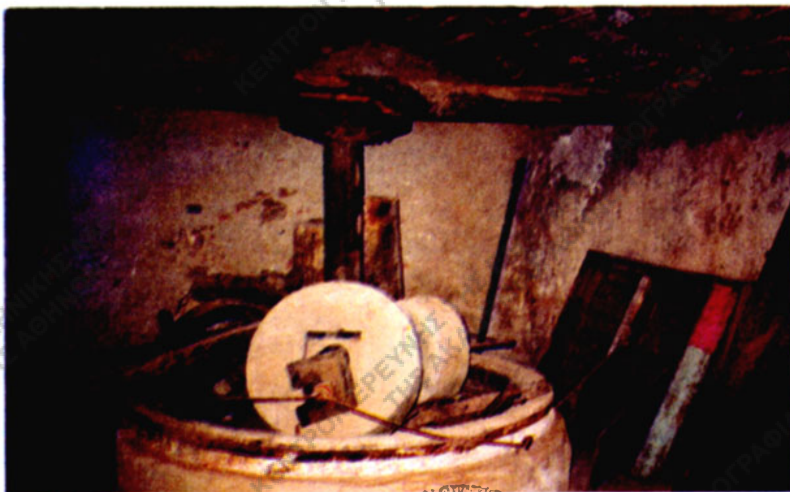
Εικ. 10. Ο χώρος αλέσεως του ελαιοκάσπου με τις μύλοπετρες, τη βάση κ.λπ. του μύλου στο παλιό ελαιοτριβείο (φάμπρικα) της Μονής Αγίας Τριάδας των Τσαγκαρόλων στο Ακρωτήρι Χανίων. Βρίσκεται σε υπόγειο χώρο στο εμπρόσθιο τμήμα της μονής, κάτω από την είσοδό της. (Φωτ. Παναγ. Καμηλάκη, 1999).