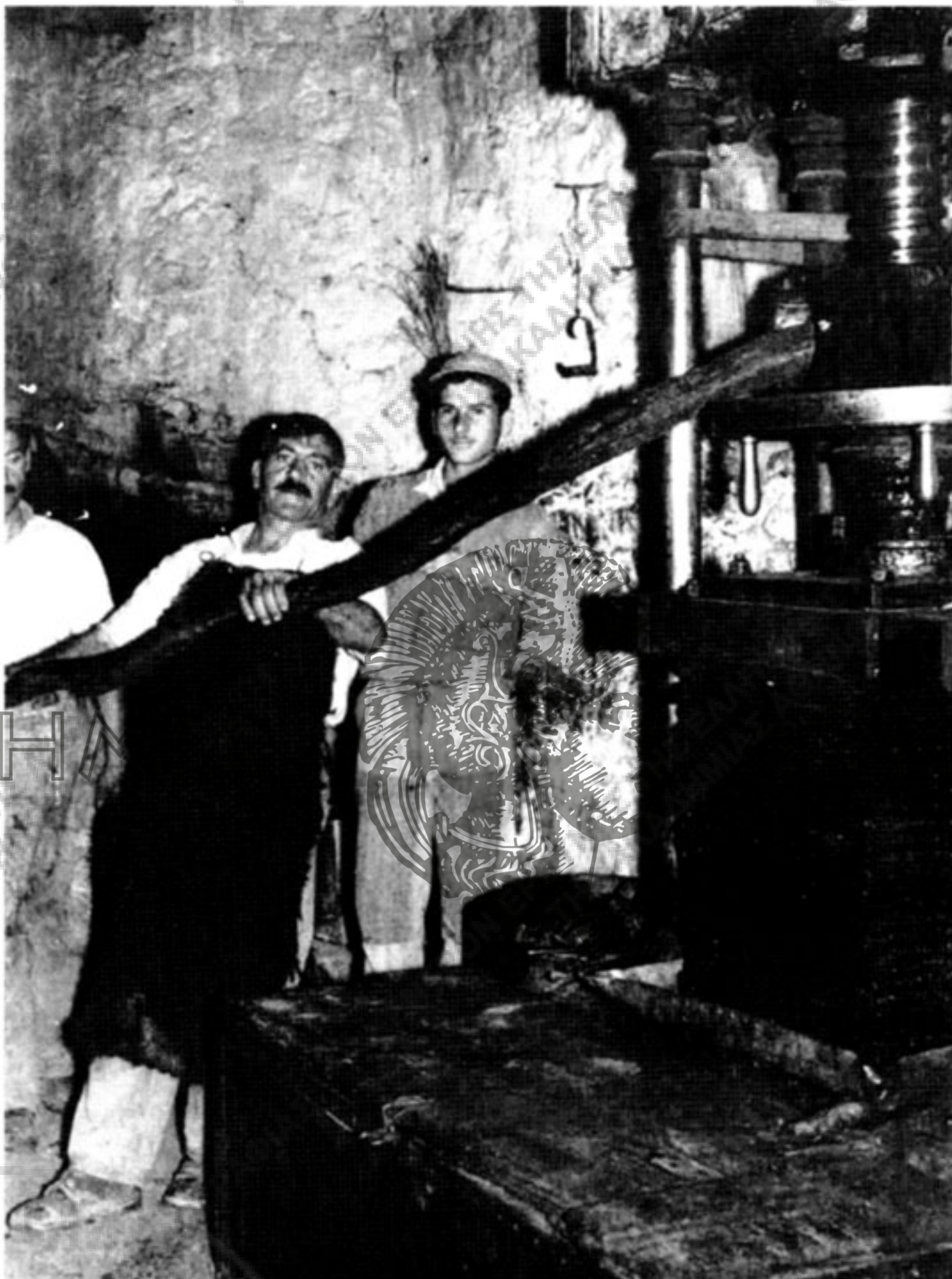
Εικ. 6. Οι εργάτες ελαιοτριβείου (αλιτριβιδιάρηδες) στο Λασιθί γυρίζουν με δύναμη τον μοχλό, που κατεβάζει το πάνω μέρος της φάμπρικας, για να συμπιεστούν οι ελιές.