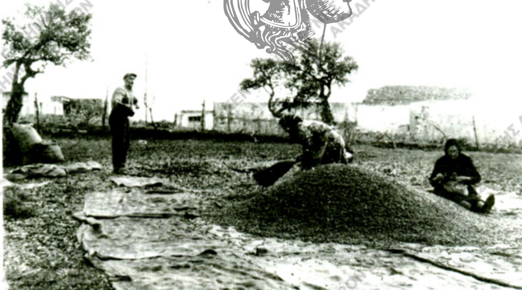
Εικ. 2. Μαζώχτρες και μαζωχτές λιχνίζουν τις συγκεντρωμένες μετά το ράβδισμα ελιές αντίθετα προς τον αέρα, για να καθαριστούν από τα φύλλα. (Φωτ. Κώστα Παπαμητσάκη, Νεάπολη Λασιθίου, φωτογραφικό αρχείο του Σ.Ε.Δ.Η.Κ., Χανιά).