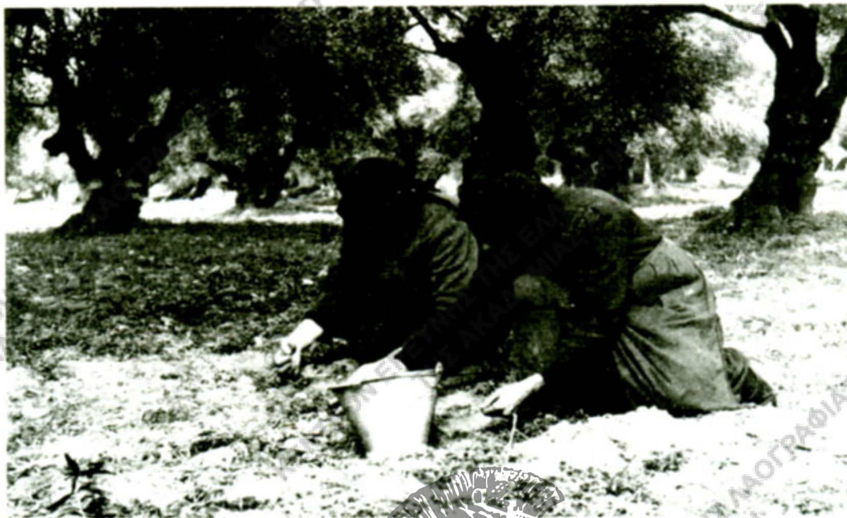
Εικ. 1. Λιομάζωμα από το έδαφος με τα χέρια στην Ανατολική Κρήτη. Οι ελιές συγκεντρώνονται «χαχαλιές-χαχαλιές» (χουφτές) μέσα σε «σίγκλα» (κουβά). (Φωτ. Κώστα Παπαμητσάκη, Νεάπολη Λασιθίου, φωτογραφικό αρχείο του Συνδέσμου Ελαιοκομικών Δήμων Κρήτης - Σ.Ε.Δ.Η.Κ., Χανιά).