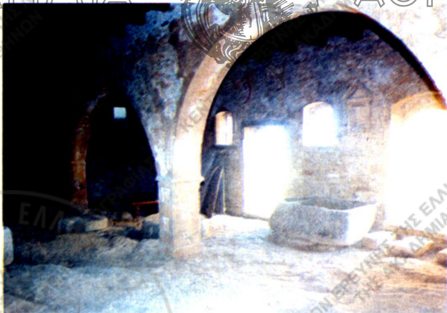
Εικ. 9. Το εσωτερικό του μοναστηριακού ελαιοτριβείου της Μονής Αρκαδίου στα Καψαλιανά Αμινάτου, στη φάση της αναστήλωσής του. (Φωτ. Λουίζας Καραπιδάκη, 2003).