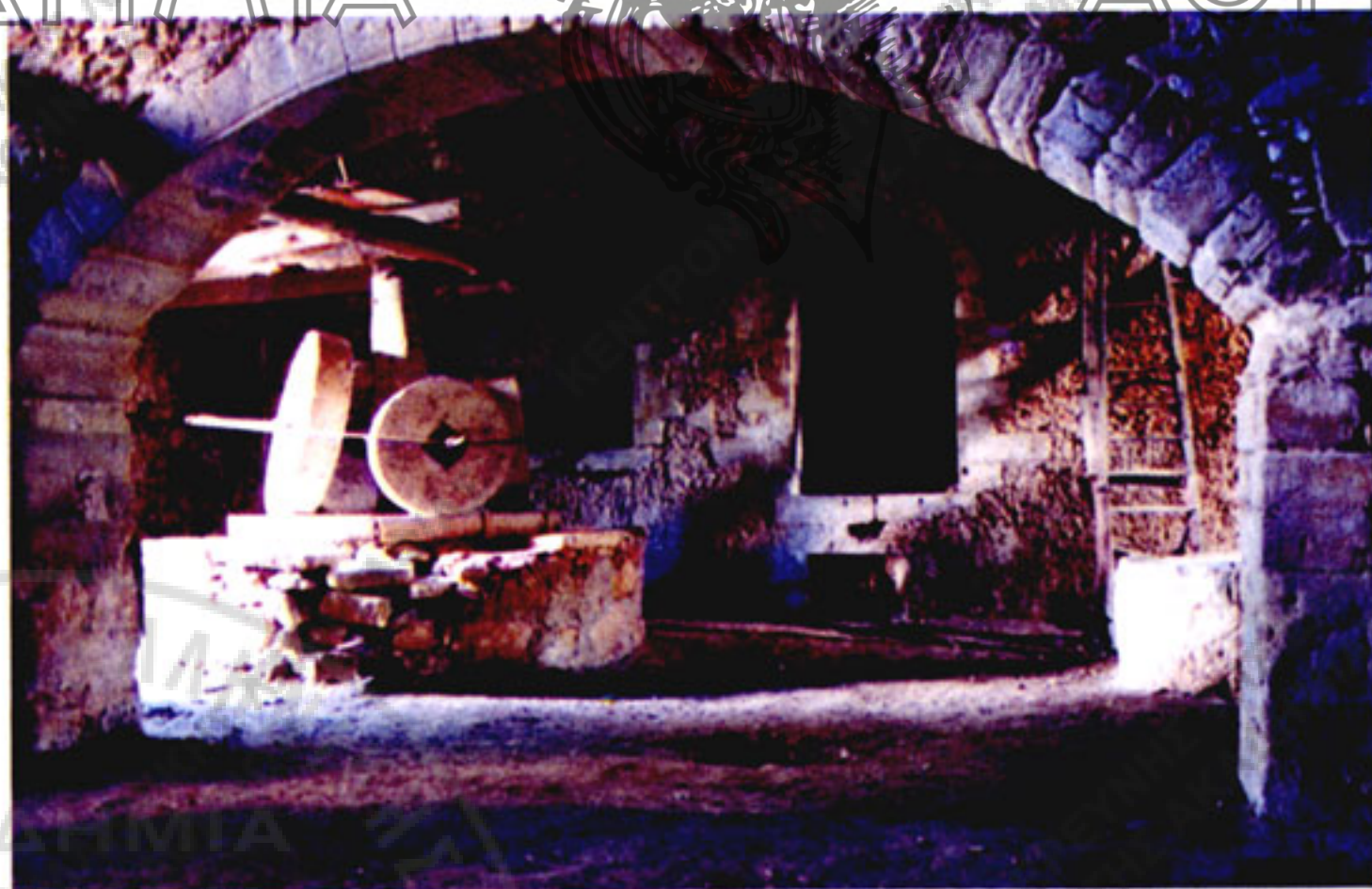
Εικ. 4. Παλαιό ελαιοτριβείο σε χαμαρόσπιτο κοντά στον Άγιο Παύλο περιοχής Βάμου, επαρχίας Αποκορώνου Χανίων, με τις μυλόπετρες πάνω στη βάση που γύριζαν και άλεθαν τις ελιές. (Φωτ. Χρυσούλας Ζήκου, Χανιά, 1999).