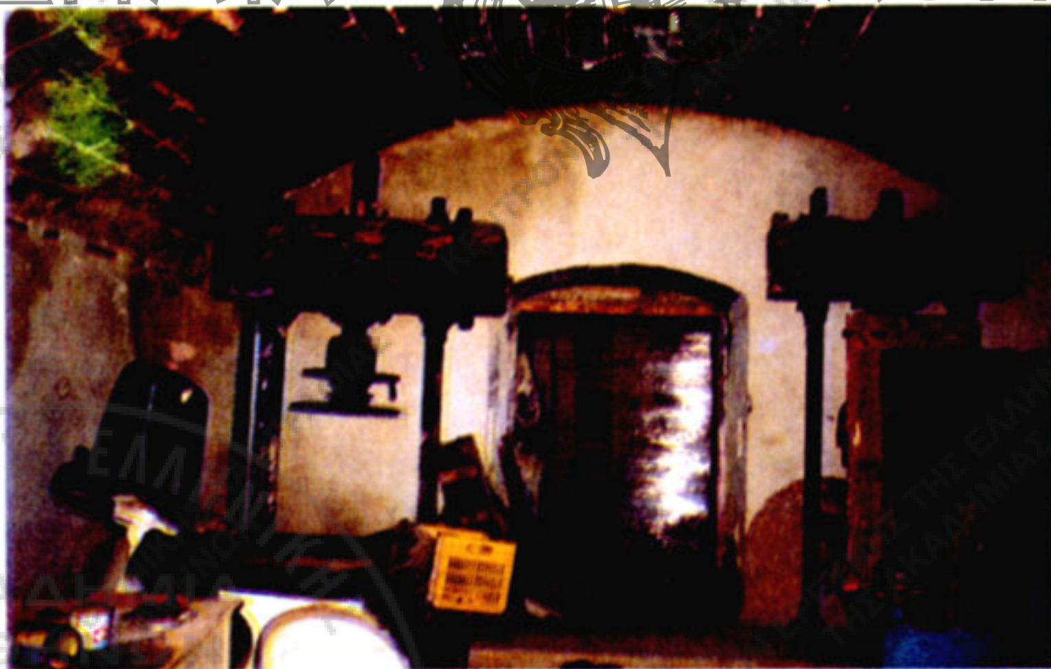
Εικ. 11. Τα δύο μεταλλικά κατά βάση πιεστήρια του ελαιοτριβείου της Μονής Αγίας Τριάδας των Τσαγκαρόλων, που στηρίζονται σε 4 μεταλλικούς δοκούς το καθένα, κατασκευασμένα πιθανόν στο τέλος 19ου-αρχές 20ού αιώνα. (Φωτ. Παναγ. Καμηλάκη, 1999).