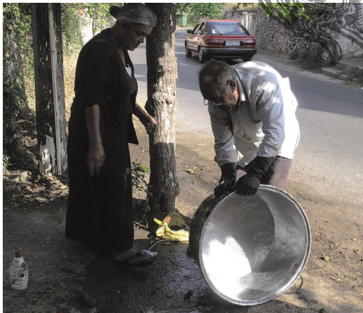
Ζευγάρι πλανόδιων γανωτήδων στο Βυζίκι. Μια τέχνη που χάθηκε μαζί με τα χάλκινα σκεύη

Ευρύτερες περιοχές όπως στην πολυτεχνική Γορτυνία με πλούτο και παράδοση τεχνικών επαγγελμάτων, αργυροχρυσοχόια, ξυλογλυπτική, βυρσοδεψία, υποδηματοποιία, οικοδομική, και πολλά παραδείγματα, παραμένουν «εν δυνάμει» αναγνωρίσιμα και αξιοποιήσιμα ως πολιτιστική κληρονομιά 38 και ως οικονομικός πόρος σε μια τοπική αειφορική ανάπτυξη.