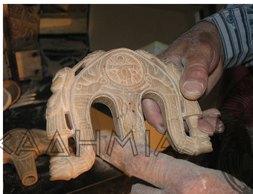
Ο μοναδικός ξυλογλύπτης στο Βαλτεσινίκο επὶ τῷ ἔργῳ