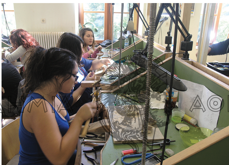
Μαθήτριες στη Σχολή αργυροχρυσοκοΐας στη Στεμνίτσα

«Ο Λάμπης Κατσούλης και ο Αριστείδης Βλαχόγιαννης έχουν πεθάνει αλλά οι υπόλοιποι στη συνέχεια όλοι είναι μαθητές τους και αυτός που έρχεται και μας κάνει μάθημα, εκτός Υπουργείου Παιδείας, και είναι φοβερός είναι ο Ντίνος Σαρακινιώτης. Είχε φύγει και γύρισε πάλι στη Στεμνίτσα. Υπάρχουν και οι Καραλήδες και άλλοι, πολλά επώνυμα Γαρταγάνηδες, Χασάπηδες που εγώ δεν τα γνωρίζω γιατί δεν είμαι από εδώ. Εκείνοι ξεκινάγανε από 13 χρονών και μάθαιναν την τέχνη. Έχουμε πάρει τα βιογραφικά τους και μας είπαν ότι στην ηλικία 13-15 χρονών πάνε στην Αθήνα σε έναν στεμνιτσιώτη αργυροχρυσοκόο και μαθαίνουν την τέχνη από μικρά. Είναι πολλοί....» (Όλγα Π., Σχολή Στεμνίτσας).