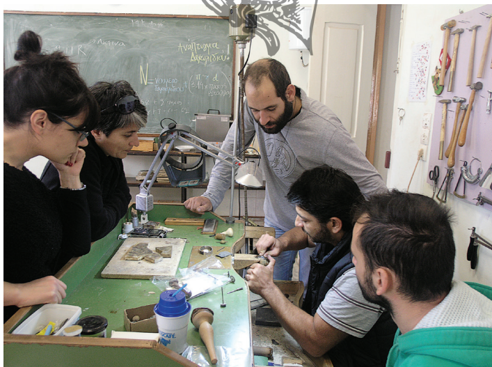
Διδάσκοντας τους μαθητές στη Σχολή αργυροχρυσοχοΐας στη Στεμνίτσα

Δεν έχουν αλλάξει. Εμείς οι τρεις προσπαθούσαμε ό τι έχουμε μάθει από τους παππούδες και εξαφανίζονται σιγά-σιγά να τα δείχνουμε στα παιδιά. Και προσπαθούσαμε να τους τα δείχνουμε και τους λέγαμε αυτό μπορεί να μη χρειαστεί να το κάνετε ποτέ, μάθετε το όμως γιατί μπορεί και να χρειαστεί. Μπορεί κάποιες τεχνικές στο μέταλλο, στο κόσμημα και να έχουν χαθεί. Σίγουρα έχουν χαθεί κάποια. Εγώ π.χ. δεν ξέρω τις αναλογίες που γίνεται το σαβάτι. Το είδα σαν μαθήτρια, το έκανα μια φορά με τον Λάμπη τον Κατσούλη όμως έμεινε εκεί. Και τώρα κανένας δεν το κάνει. Το σαβάτι είναι κάτι φοβερό για μένα, όμως δεν μπορώ να πω ότι ξέρω τις αναλογίες. Βέβαια αν μου πει κάποιος να το παλέψουμε κάτι θα βγάλουμε και με τις σημειώσεις που έχω κρατήσει. Σε ένα σχολείο οι ώρες είναι πολύ λίγες και δεν μπορείς να δώσει τα πάντα στα παιδιά. Εγώ θεωρώ ότι το σχολείο θα πρέπει να είναι 3 και όχι 2 χρόνια και να έχει πολλές ώρες εργαστήριο». (Ε.Σ. Ζάτουντα 2013).