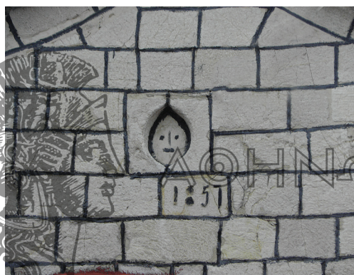
Ο Ι.Ν. Κοιμήσεως της Θεοτόκου στο Μοναστηράκι και επιγραφή, έργο τοπικών μαστόρων

Η υφαντική αποτέλεσε έναν σημαντικό τομέα της μεταποιητικής δραστηριότητας των αγροτικών κοινοτήτων με έμφυλα χαρακτηριστικά καθώς βρισκόταν αποκλειστικά στα χέρια των γυναικών και μεταβιβαζόταν από αυτές.