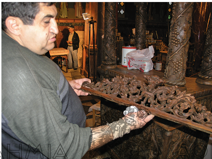
Επισκευές στο ξυλόγλυπτο τέμπλο του Ι.Ν. Αγίων Θεοδώρων στο Βαλτεσινικό, έργο των αδελφών Ντινόπουλων (μέσα 19ου αι.)

Η μαρτυρία-αφήγηση του Βαλτεσινικιώτη ξυλογλύπτη Παναγιώτη Κ. που ασκεί το επάγγελμα μέχρι σήμερα αναδεικνύει το στάδιο της μαθητείας στη σχολή ξυλογλυπτικής του ΕΟΜΜΕΧ και τις σημερινές συνθήκες άσκησης ενός παραδοσιακού τεχνικού επαγγέλματος.