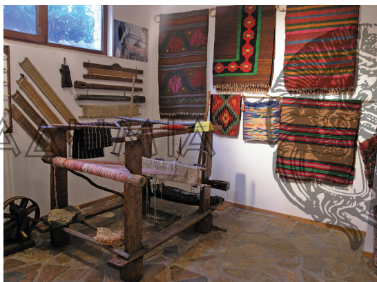
Αργαλειός και υφαντά στο λαογραφικό μουσείο στο Ράφτη

Ο ρόλος των μουσείων είναι κομβικός στη διάσωση και διάδοση των τεχνικών και της τεχνικής πολιτιστικής κληρονομιάς καθώς λειτουργούν σε τόπους οι οποίοι αναδείχθηκαν σε κέντρα μεταποιητικών δραστηριοτήτων. Η αξιοποίηση του τοπικού τεχνικού δυναμικού με συγκέντρωση πληροφοριών, οπτικο-ακουστική καταγραφή των παραδοσιακών τεχνικών -όπου ακόμα αυτές εφαρμόζονται- και κυρίως η συστηματική διοργάνωση εργαστηρίων και σεμιναρίων για εκμάθηση των τεχνικών στη νέα γενιά θα πρέπει να περιλαμβάνονται στις δράσεις ενός εθνογραφικού τεχνολογικού μουσείου.