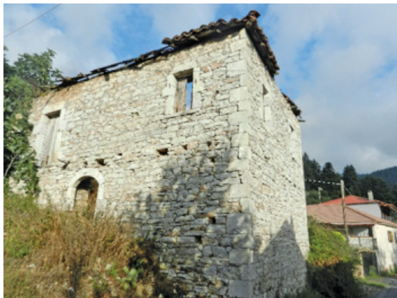
Έργο Γορτύνιων μαστόρων το πέτρινο σπίτι στη Σύρνα;