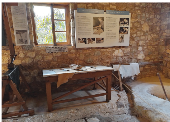
Αποψη από τα εκθέματα του βυρσοδεψείου στο Υπαίθριο Μουσείο Υδροκίνησης στη Δημητσάνα