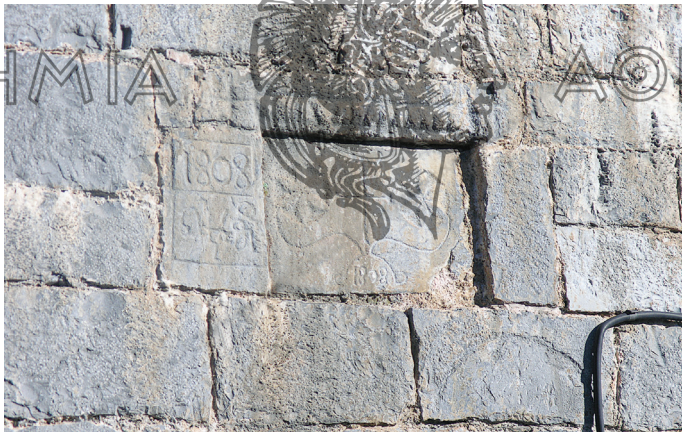
Λιθανάγλυφη χρονολογημένη επιγραφή σε εκκλησία

Αύγουστο και ερχόμασταν πάλι τέτοια εποχή, τέλη Οκτώβρη για να σπείρουμε. Αναλόγως τη δουλειά. Εγώ πήγα το '54 σε ένα χωριό εδώ κάτω στα Τριπόταμα. Κάναμε ένα δημοτικό σχολείο σε ένα χωριό, Ποροκίο λέγεται. Δεν υπήρχε δημοσιότητα τότε και πηγαίναμε με τα ζώα. Ήρθαμε εδώ τον Αλωνάρη, τον θεριστή που λέγαμε, τον Ιούλιο για να θερίσουμε, να αλωνίσουμε, βάλαμε τα σιτηρά μέσα, άχυρα για τα ζώα, κάναμε ξύλα, έλατα για να ξεχειμωνιάσουμε. Φύγαμε εκείνη τη χρονιά πριν της Παναγίας, στις 5 Αυγούστου πάλι για τα Τριπόταμα, Λάμπεια λέγεται και μεγάλη Δίβρη και καβαλήκαμε το βουνό και πήγαμε σ' ένα χωριό Τσίπιανα το λέγανε είχε πάρει ένα σπίτι ο πατέρας μου. Μετά κατεβαίνουμε στο Κακοτάρι είναι ένα μοναστήρι της Παναγίας. Φτιάξαμε εκεί έναν ξενώνα και μετά κατεβήκαμε στο Ανδρόνι όλα αυτά στο Ν. Ηλείας και ήρθαμε πάλι εδώ να σπείρουμε. Σεπτέμβρη-Οκτώβρη φύγαμε πάλι για ένα χωριό στον Αάλα, Τάριζα το λέγαν τότε τώρα Αχλαδινή. Το χωριό αυτό δεν είχε νερό και πήραμε ένα μουλάρι από εδώ για να κουβαλάμε το νερό. Γυρίσαμε πριν τα Χριστούγεννα και ξαναφύγαμε την άνοιξη, μετά τις απόκριες, την Καθαρά Δευτέρα που άνοιγε ο καιρός. Μιλάμε τώρα για 60 χρόνια πίσω...». (Δ.Π., Λαγκάδια 2013).