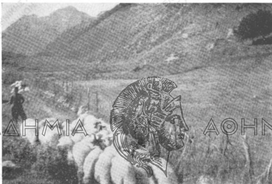
Εἰκ. 1. Παρὰ τὸ ἱστορικὸν «Σούλι». Εἰς τὸ βάθος διακρίνεται τὸ Κάστρον τοῦ Σουλίου παρὰ τὴν «Κιάφαν» καὶ ὁ θρυλικὸς λόφος τοῦ «Κουγκίου».

τρίωρον ἀπόστασιν βορείως τοῦ Σουλίου ἐντὸς Ἰβηθείας λεκάνης, σχηματιζομένης ἀπὸ τὰ ὄρη Βριτζάχα καὶ Ζαβροῦχος , καὶ διαρροεμένης ἀπὸ τὸν Τσαγγαριώτικον , κεῖνται τὰ χωρία Αὐλότοπος (παλαιότερον Γκλάβιστα ), Τσαγγάρι , Κουκλιοὶ καὶ Φροσύνη (παλαιότερον Κορίστιανη ). 1 Ἀπασα ἡ περιοχὴ εἶναι ἄνυδρος καὶ ἄγονος 1 . Μόνον ὁ Ἀβαρίκος εἶχε καὶ ἔχει πηγὰς, ἡ δὲ Κιάφα, ἡ Σαμονίβα καὶ τὸ Σούλι ὑδρεύοντο ἀπὸ πηγάδια, μερικὰ τῶν ὁποίων σφύζονται ἀκόμη, χρησιμεύοντα εἰς