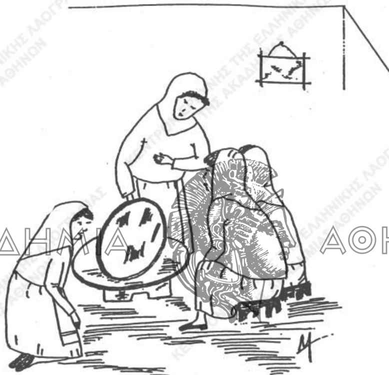
Η πρακτική του λγγεριού - ταψιού