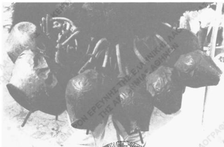
Εικ. 4. Τα κουδούνια ενός «Μέρου» της Σκύρου.