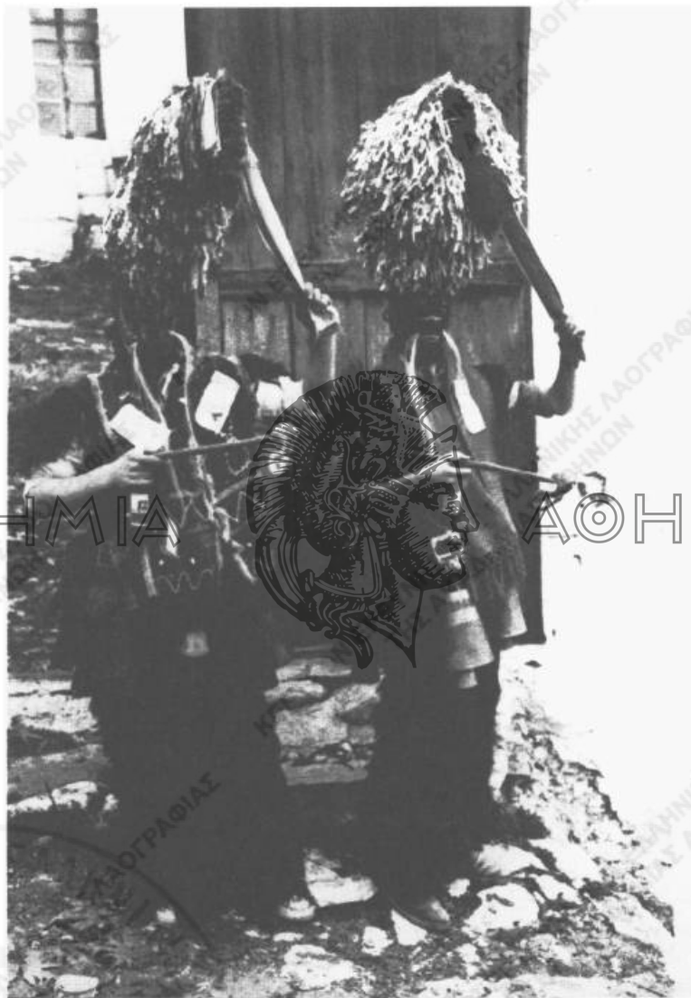
Εικ. 3. «Καρναβάλια» του Σοχού Θεσσαλονίκης (1978).