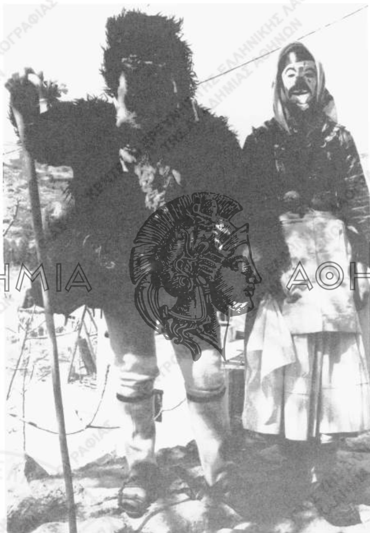
Εικ. 2. «Γέρος» και «Κορέλα» της Σκύρου (φωτ. Γ.Ν. Αικατ., 1978).