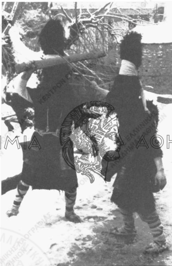
Εικ. 1. «Αράπηδες», μεταμφιεσμένοι τον Δωδεκαήμερον στη Νικήσιανη Καβάλας (1979).