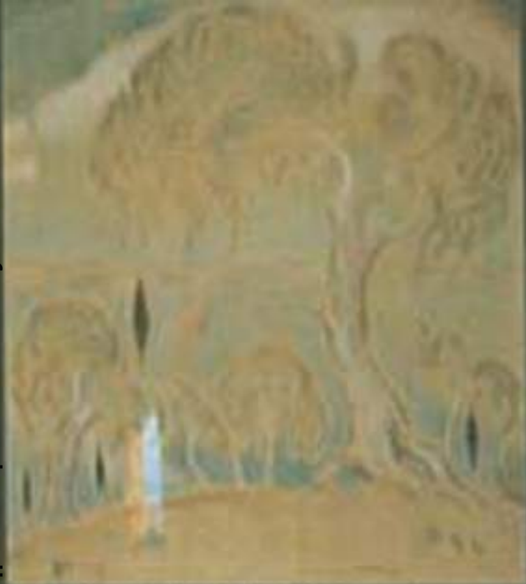
Κωνσταντίνος Παρθένης (1878-1967)

Ελιές Λόδι σε μουσαμά, Συλλογή Alpha Bank.