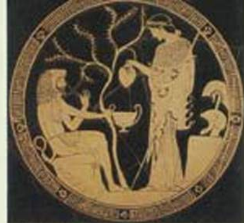
Ο Ηρόκλης κουρασμένος ξεποστώνει στον ήλιο της ελιάς. Η πιστή προστάτις του, η θεά Αθηνά, γεμίζει κρούσι το κύπελλό του. Εσωτερικό τουβρόμορφης κύλικας. Γύρω στο 470 π. Χ. (Μόναχο, Staatliche Antikensammlungen).

Heracles, weary from his labours, is depicted here sitting in the shade of an olive tree and relaxing. His faithful protector, Athena, approaches to fill his cup with wine. Interior of red-figure kylix. Ca 470 B.C. (Staatliche Antikensammlungen).