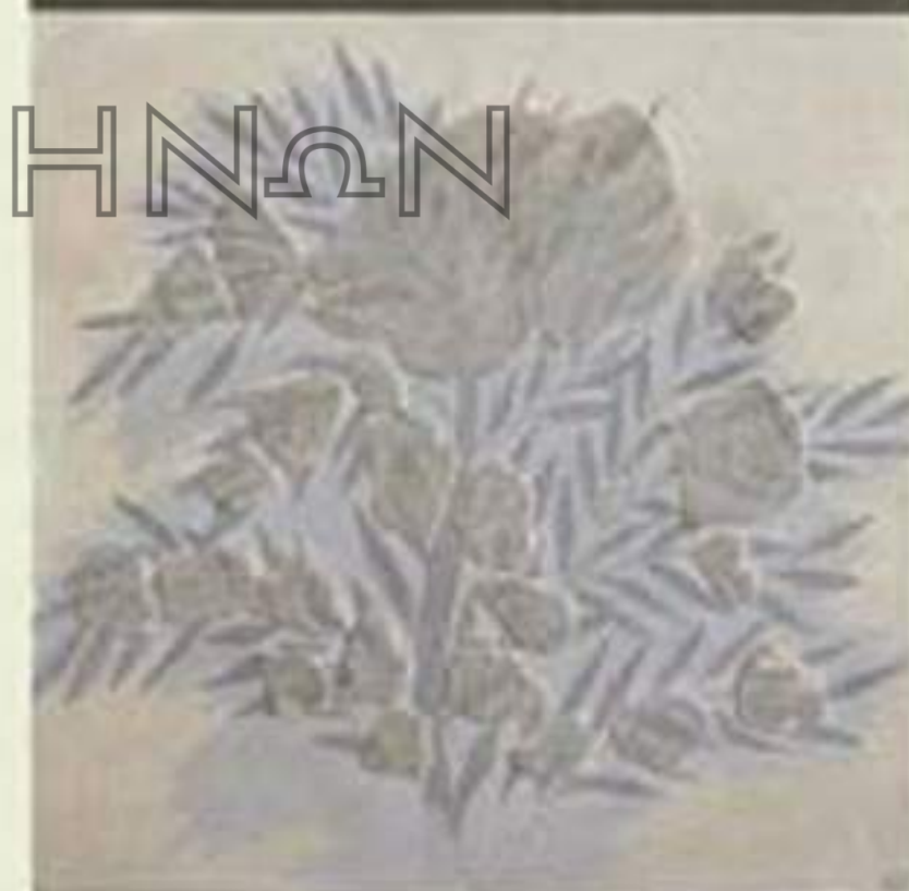
Ρεαλιστική αναπαράσταση ελαιώνος σε τοιχογραφία από το μινωικό ανάκτορο της Κνωσού (16ος π.Χ. αιώνας).

Heracles, weary from his labours, is depicted here sitting in the shade of an olive tree and relaxing. His faithful protector, Athena, approaches to fill his cup with wine. Interior of red-figure kylix. Ca 470 B.C. (Staatliche Antikensammlungen).