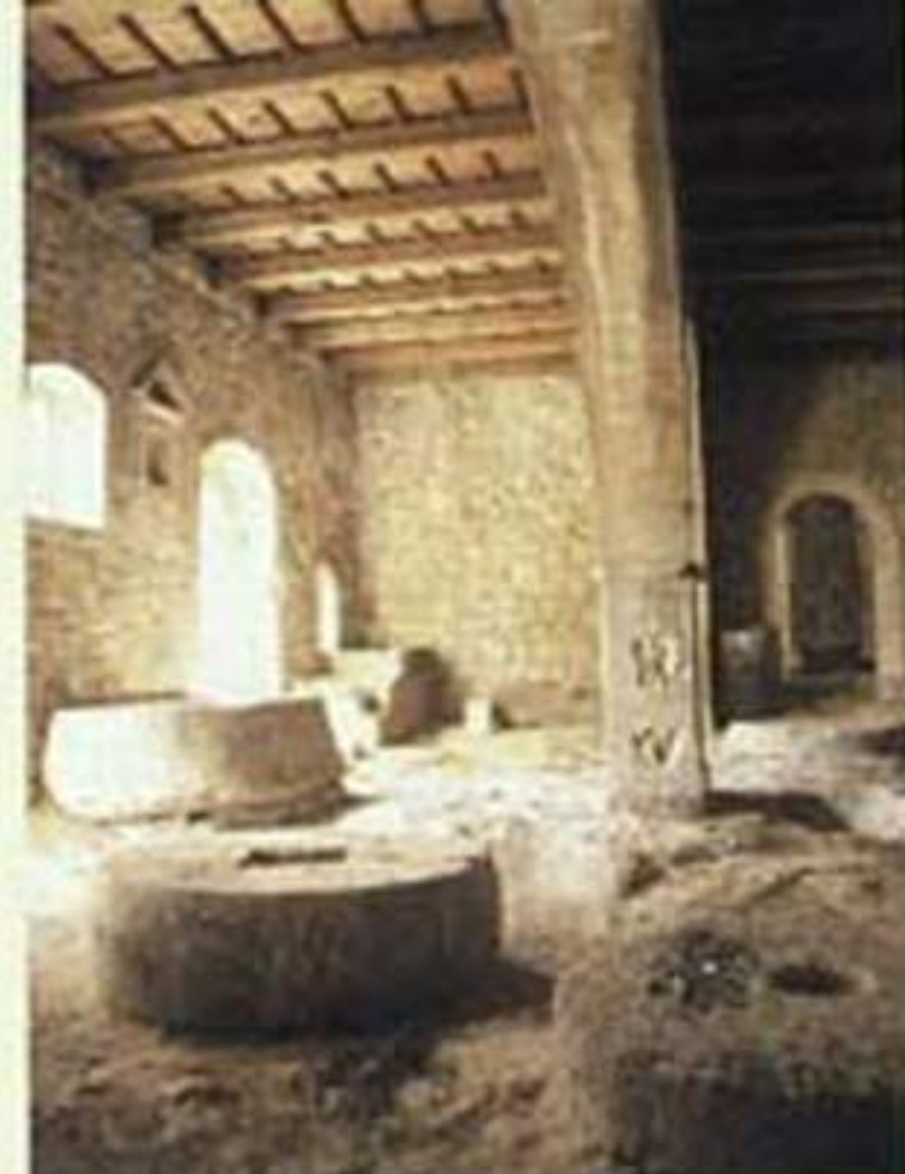
Επάνω: Εσωτερικό του μοναστηριακού ελαστριβείου της Μ. Αρκαδίου. Κάτω: Πανέριο ελασοσυγκομιδής. Ελληνικό Μουσείο της Ελιάς, Κασαλιανά Αρκαδίου Κρήτης.

The dreams of men who walk through this landscape are simple - to have their midday meal "on cool vine leaves, a meal of olives, bread, tomato, salt, hungry as they are", and to rest in the same place where "initate of the olive leaves", as Odysseas Elytis puts it, lives for ever, in the same ashen-green landscape that dwells within the Greek soul, wherever we are.