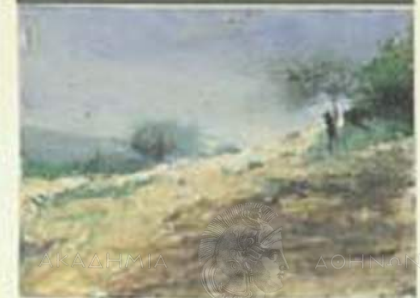
Γιώργος Ρόρρης Τοπίο κάτω από το φως του ήλιου, 1998. Ιδιωτική Συλλογή. Yorgos Rorris Landscape under the sun, 1998. Private Collection.