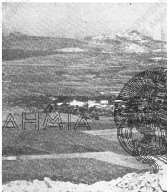
Εἰκ. 2. Ἡ Ζεφυρία (Παλαιὰ Χώρα).

ναι 1904, σ. 111 - 12, ἀρ. 199. Μέρος Β', σ. 798 - 99), Κάρπαθον (βλ. Μ. Μιχαηλίδου Νουάρου, Λαογραφικά σύμμεικτα Καρπάθου, τόμ. Α', Ἀθήναι 1932, σ. 229 - 33), Ρόδον (βλ. Ἀναστ. Βρόντη, ὁ Ἅγιος Γεώργιος στὴ Ροδίτικη λαογραφία. Λαογραφ., τόμ. 11 (1934 - 37) σ. 239 - 240), εἰς Νίσυρον, ὡς ἤκουσα αὐτὴν ἐκεῖ τὸ 1956 κ. ἄ. Αἱ παραδόσεις αὗται, ἀρκούντως παλαιαί, ἔχουν διαπλασθῇ εἰς τὰς νήσους ἐκ τοῦ κοινοῦ εἰς αὐτὰς κινδύνου τῶν ἐπιδρομῶν ὑπὸ πειρατῶν ἤδη ἀπὸ τῶν μέσων χρόνων.