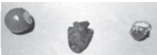
Εικ. 2: Περίαπτα της ευτοκίας.