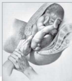
Εικ. 6: Χειρισμοί της εμπροσθομαμμής κατά τον τοκετό.