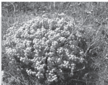
Εικ. 1: Teucrium polium .

πεθεράς επέφερε λόγω της ισχυρής τάσης για έμετο την αύξηση της ενδοκοιλιακής πίεσεως, και γ) αύξανε την αοττοιακή πίεση της εξαντλημένης γυναίκας. Έτσι επανέρχονταν οι συσπασμένες συστολές της μήτρας. Η συγκράτηση, τέλος, του περινέου με ύφασμα εμβαπτισμένο σε αλατούχο νερό βοηθούσε στην χαλάρωση του περινέου κατά την εξώθηση μειώνοντας τις φοβερές τελικές ωδίνες και προστατεύοντας το περινέο να μη ραγίσει (σχισθεί).