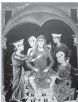
Εικ. 4: Στάσεις κατά τον τοκετό.

Η χρήση των εργαλείων της μαμμής γινόταν σε δυσαναλογία πυέλου-εμβρύου, αλλά και σε πολλά άλλα αίτια, που προέρχονταν από την μητέρα ή το έμβρυο.