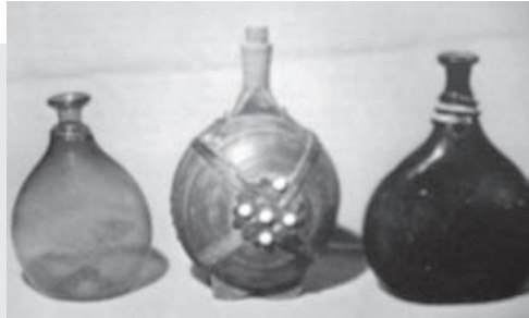
Εικ. 3: Νεραΐδοσφόντυλα και λευτεροφλάσκια.

ελέγχεται από τις συγκινήσεις και δεν υπακούει στη βούληση. Η μαμμή κατά το πρώτο μακρύ μέρος του τοκετού καθοδηγούσε την επίτοκο να αναπνέει αργά και βαθιά. Στο δεύτερο στάδιο του τοκετού, της εξωθήσεως, προκειμένου η γυναίκα να ελευθερωθεί με μια γλυκιά φωνή, η παραδοσιακή μαμμή είχε επινοήσει και χρησιμοποιούσε ένα αποτελεσματικό ωκυτόκιο, το λεγόμενο «λευτεροσφόντυλο», το οποίο συντόνιζε το εύρος της εισπνοής και της εκπνοής του αέρα (βλ. εικ. 3 και Παράρτημα, σ. 1167).