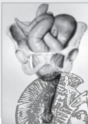
Εικ. 5: Ανώμαλε προβολές που προκαλούν δυστοκία.