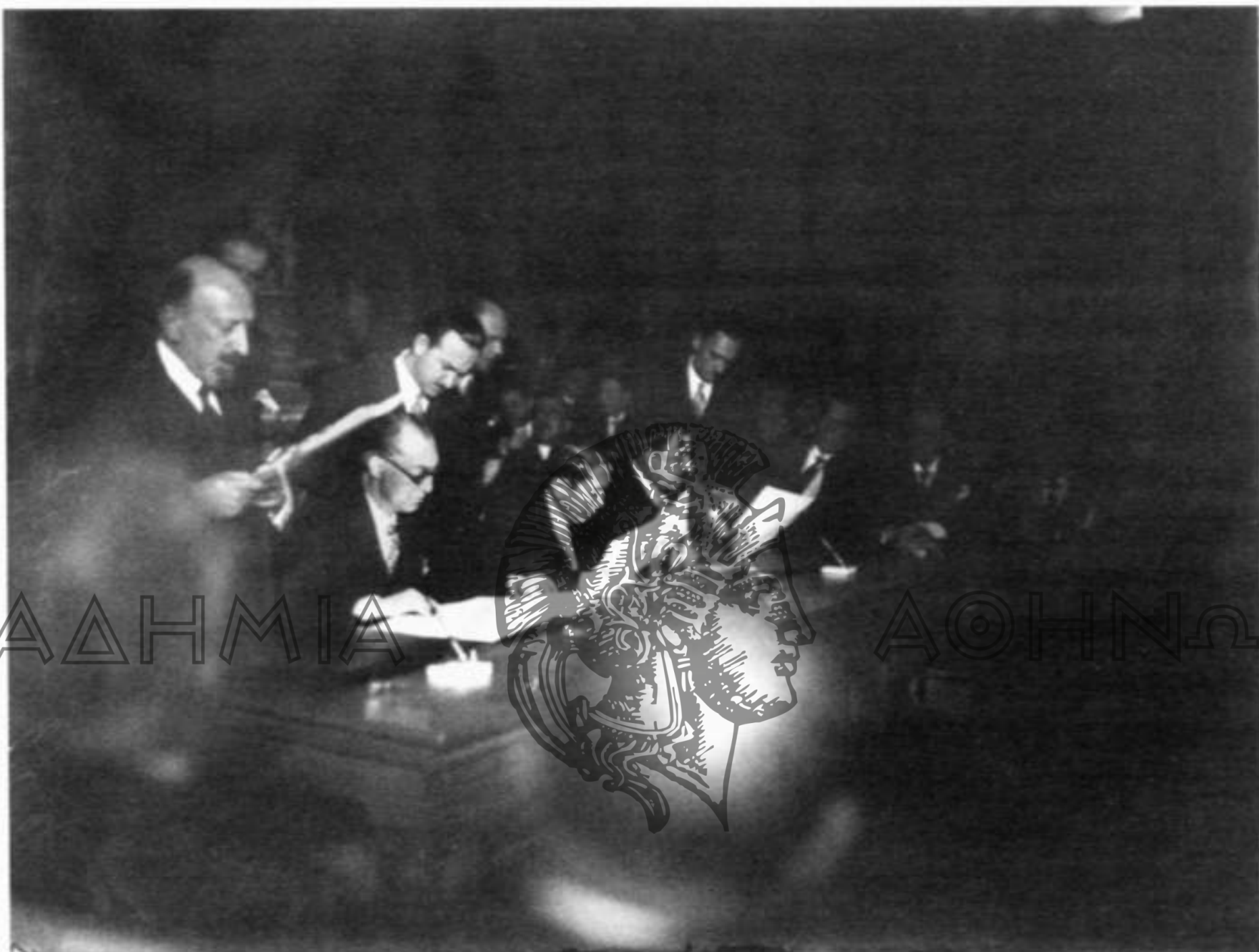
Υπογραφή Βαλκανικού Συμφώνου στην Ακαδημία Αθηνών.