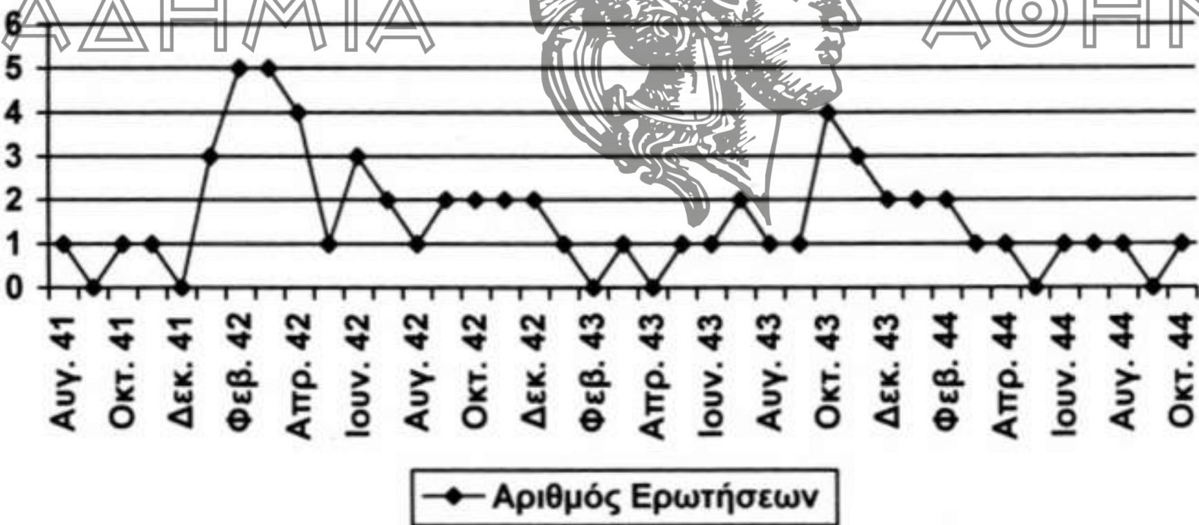
Γράφημα 1 Συχνότητα υποβολής των ερωτήσεων